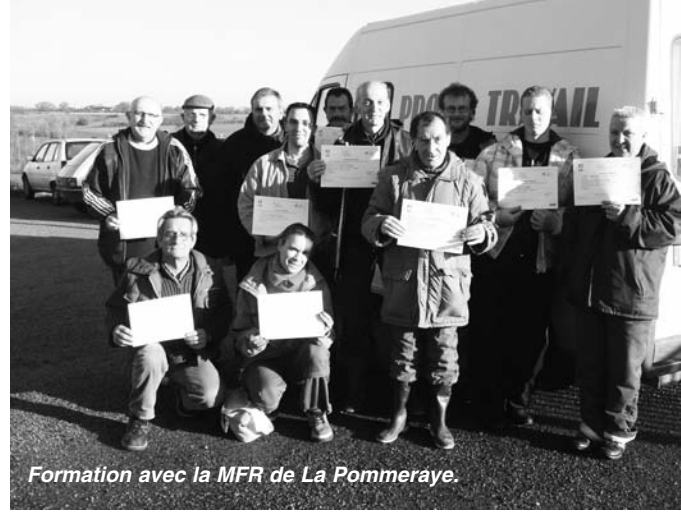
Formation avec la MFR de La Pommeraye.

Le deuxième axe est l' accompagnement qui est délivré au quotidien. Il consiste à aider les salariés dans leur recherche d'emploi ou de formation. Grâce à la bonne participation des Collectivités et des Entreprises du Canton, nous avons réalisé 11 EMT (Evaluation en Milieu du Travail) en 2009 qui favorisent l'accès à l'emploi.